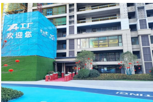
青島奧園首府壹號A+工廠

奧園A+工廠推行「所見即所得」，以項目為單位，在項目銷售階段打造交付區樣板段，展示從土工工序到精裝交付多維度的建造環節，提前呈現未來家園環境、生活場景，讓客戶擁有更好的購房體驗，交付更匹配客戶需求。