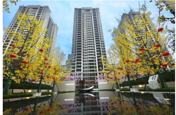
重慶奧園翡翠天辰