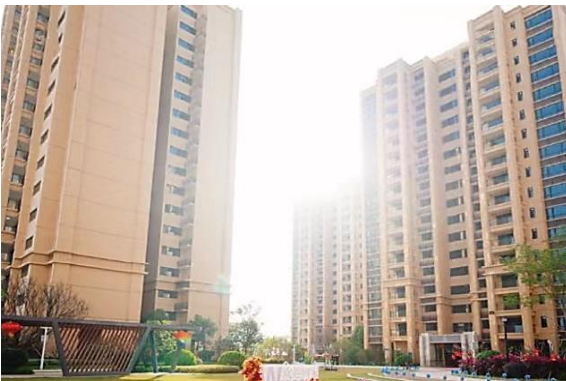
珠海奧園麗景花園