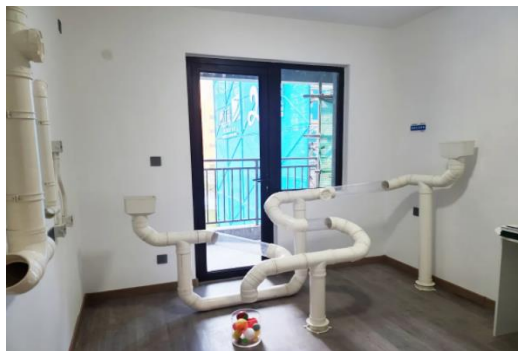
DIY室—現場通水通球管道試驗