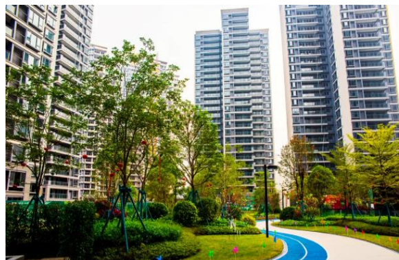
梅州融創奧園玫瑰台